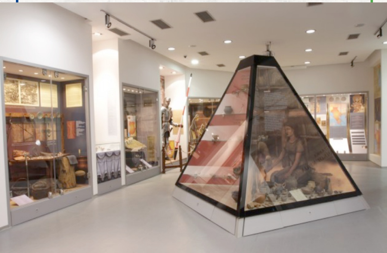
Sl. 14. Narodni muzej Leskovac, nova postavka Vremeplov leskovačkog kraja iz 2015. godine

I u lokalnim muzejima postavke teže ka predstavljanju generalne slike, informativne (Sl. 14). Sveobuhvatnost predstavljanja Rimskog carstva ne treba da bude cilj svakog muzeja: usmeravanje na lokalno značajne teme, preko relevantnih