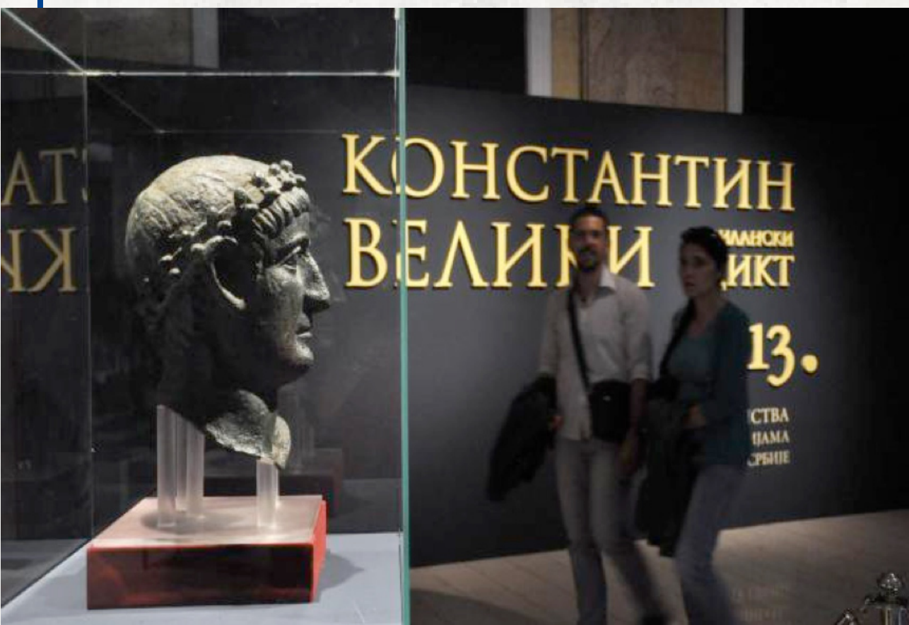
Sl. 17. Izložba Konstantin Veliki i Milanski edikt. 313, Narodni muzej u Beogradu, 2013. godina.

Muzej je bio kreirao izložbu koja je u skladu s pre-koncepcijama koje su česte u javnosti, o drevnoj, staroj kulturi koja se oslanja i na rimsko nasleđe, o linijskoj vezi između rimske države i današnje Srbije. Kustosi su mogli upravo u odnosu