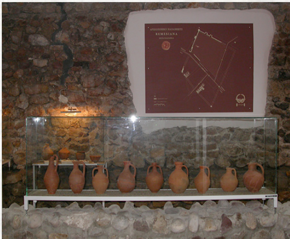
Sl. 9. Muzej u Beloj palanci, nova postavka iz 2013. godine