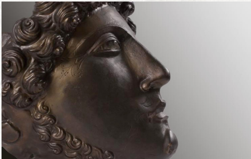
Sl. 10. Lepota kao stvar vere: paradni šlem, 2. vek (Narodni muzej u Beogradu)