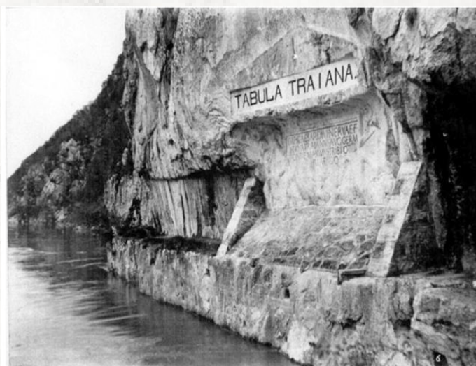
Sl. 4. Trajanova tabla, Đerdapska klisura