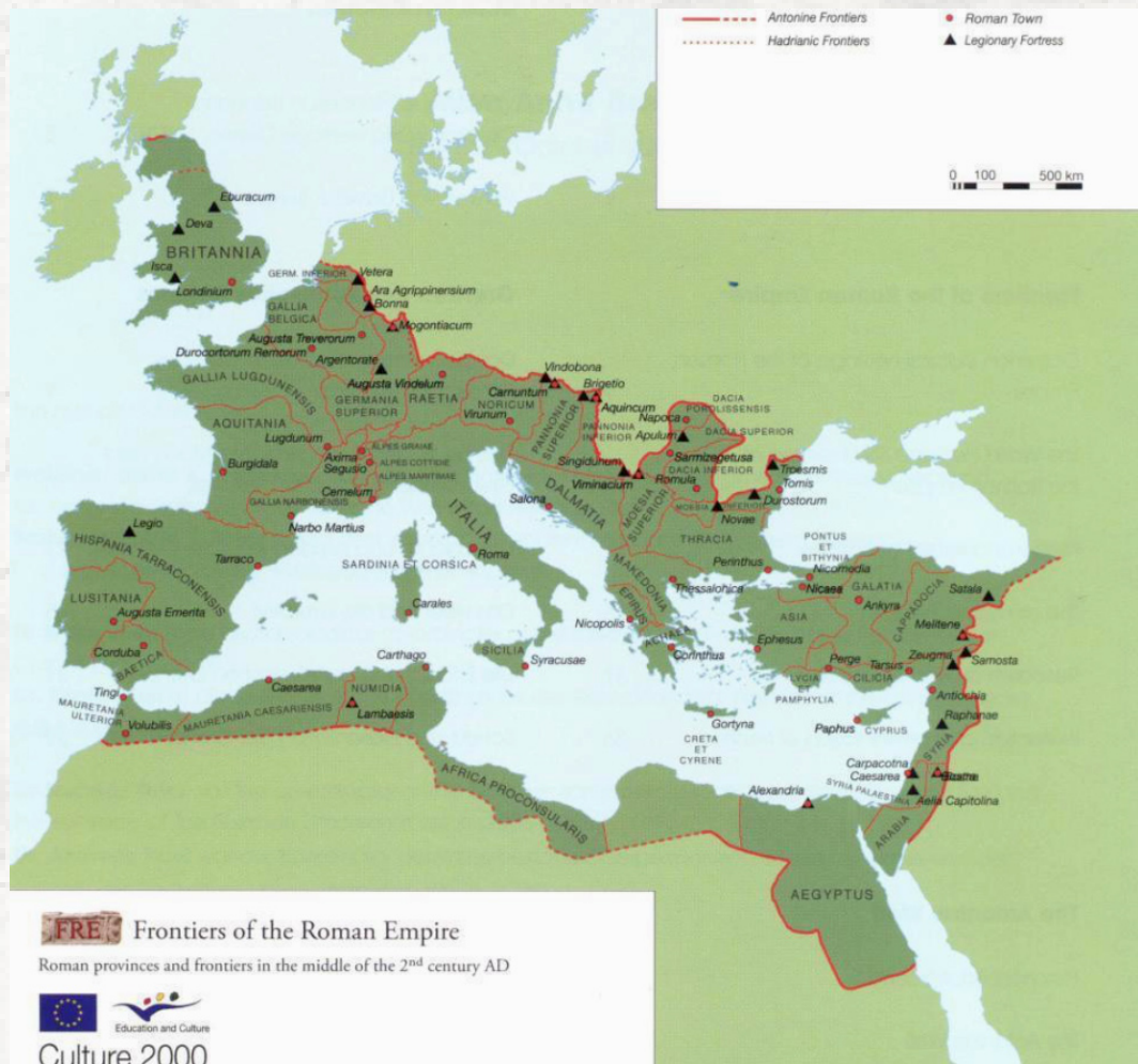
Sl. 3. Mapa granica Rimskog carstva - Frontiers of the Roman Empire (© FRE)