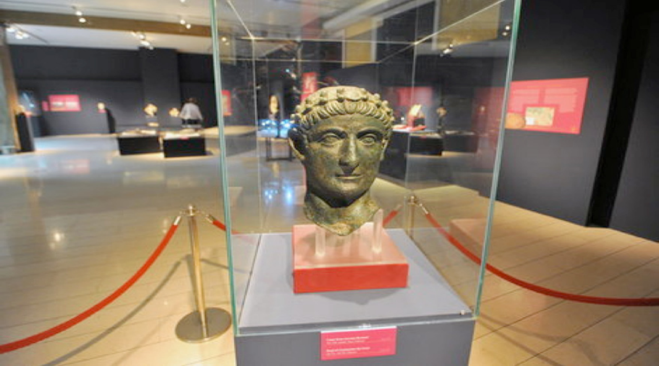
Sl. 15. Izložba Konstantin Veliki i Milanski edikt. 313 , Domus scientiarum u Viminacijumu, 2013.

kada su centralni Balkan i naročito teritorija današnje Srbije dospeli u „samu žižu istorijskih i kulturnih zbivanja o čemu blistavo svedoči arheološko nasleđe našeg tla“ (Sl. 16).