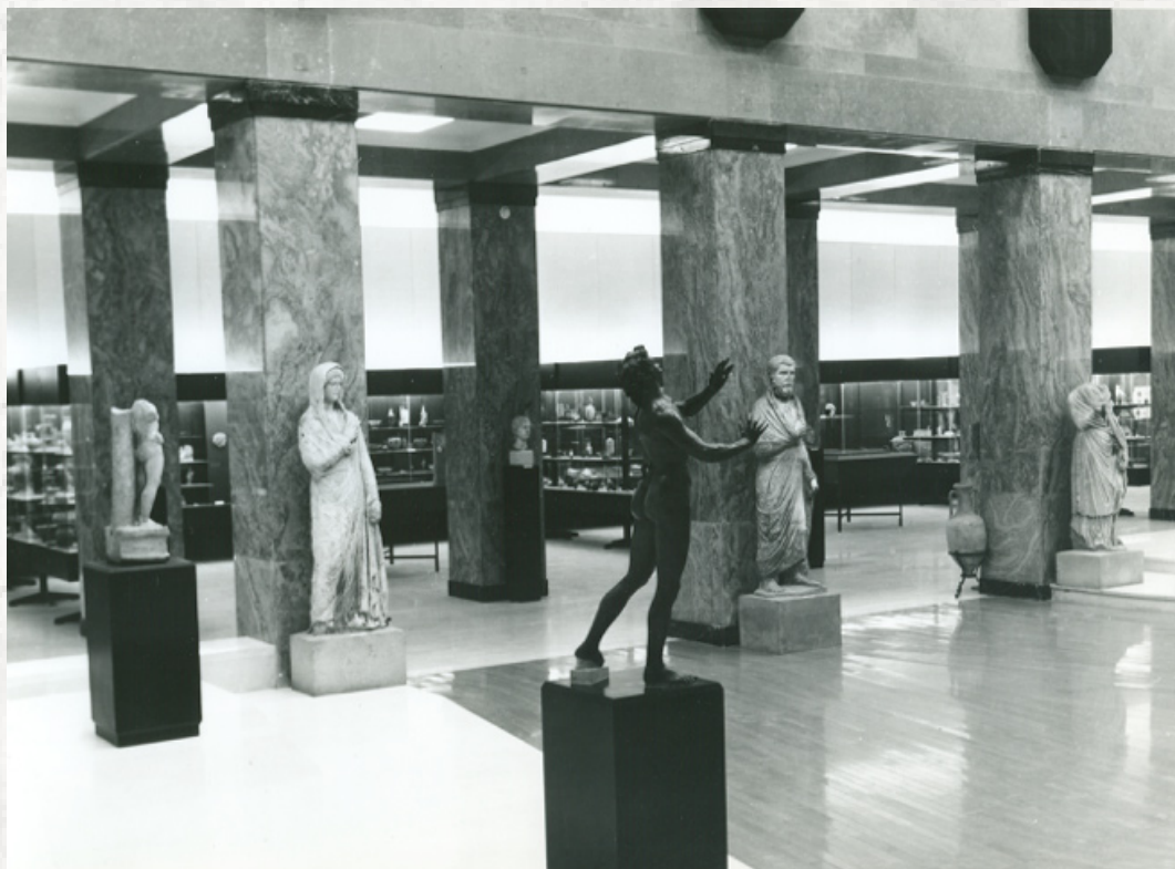
Sl. 12. Arheološka postavka Narodnog muzeja, 1960/70-te

tar grčkih i rimskih portreta, statua i dekorativne plastike ističe veličanstvenost antičke umetnost koju baštini Srbija potvrđujući simboličnu snagu i prestiž koju i dalje imaju Grčka i Rim: ovo prisvajanje treba da ukaže da je i Srbija na mapi civilizovane Evrope, one koja direktno nasleđuje antičku kulturu i njene institucije. U postavci iz 1980-ih, mada su iz ovog centralnog dela gotovo potpuno uklonjene skulpture, dominantna je ostala antička umetnost, koja dobija dve trećine izložbenog prostora u prizemlju.