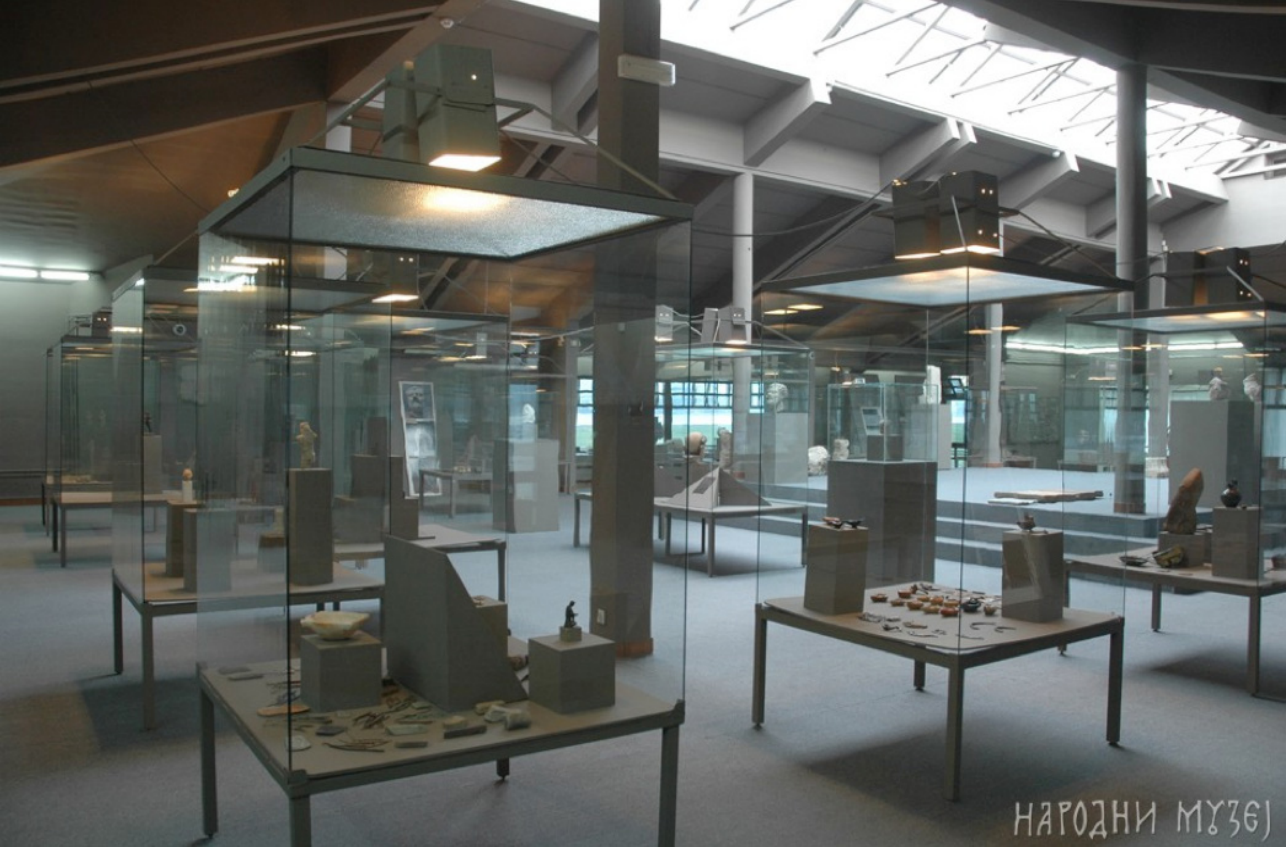
Sl. 13. Postavka Arheološkog muzeja Đerdapa, 2000-te

života, a arheološki zapisi postavljaju pre svega lepotu u fokus, „bezvremenu sposobnost čoveka kao umetnika“ Prošlost je monolitna, veličanstvena.