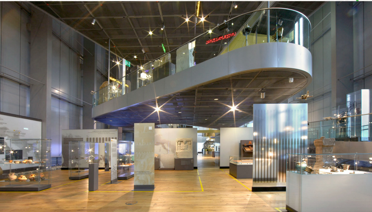
Sl. 8. Muzej u okviru Arheološkog parka Ksanten