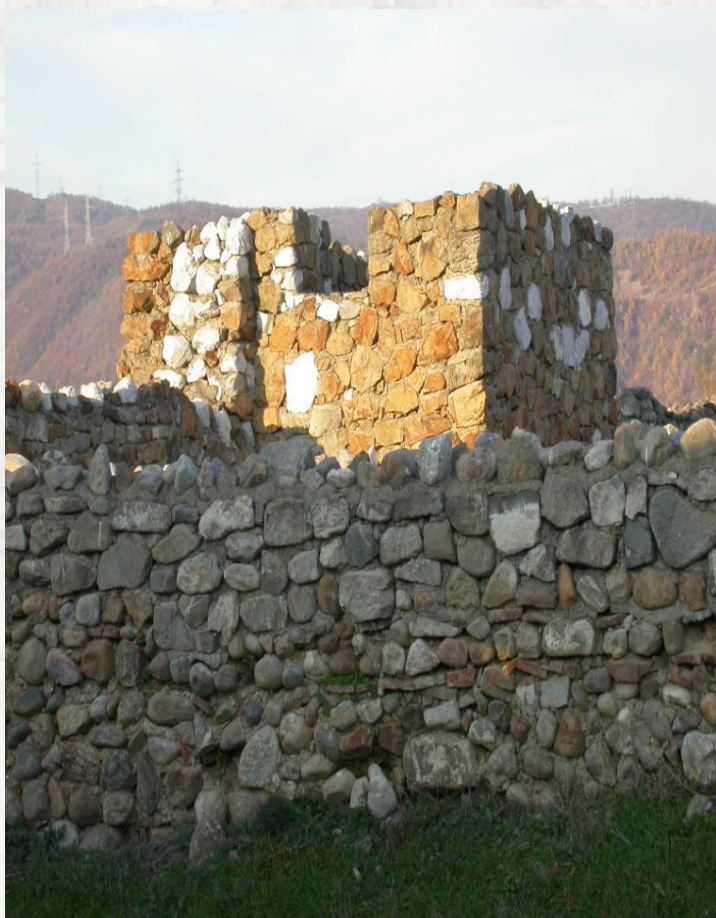
Sl. 5. Utrđenje Dijana, kod Kladova

Posebno su značajne palate, impresivne građevine koje su podigli impera-