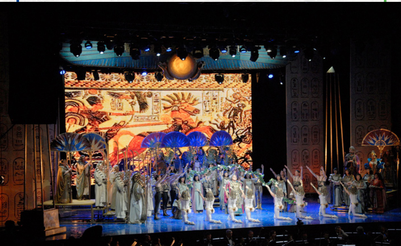
Sl. 18. Izvođenje opere Aida na Viminacijumu, 2013. godina

U želji da se istorija učini opipljivom, u pokušaju da se „vizualizuju obrasci života”, uglavnom dolazi do iskrivljene slike arheološkog nasleđa, koja se često prihvata kao realnost. Ovakva artefaktualna istorija nužno ignoriše ili trivijalizuje ceo spektar društvenih iskustava, poput rata, eksploatacije, gladi ili bolesti.