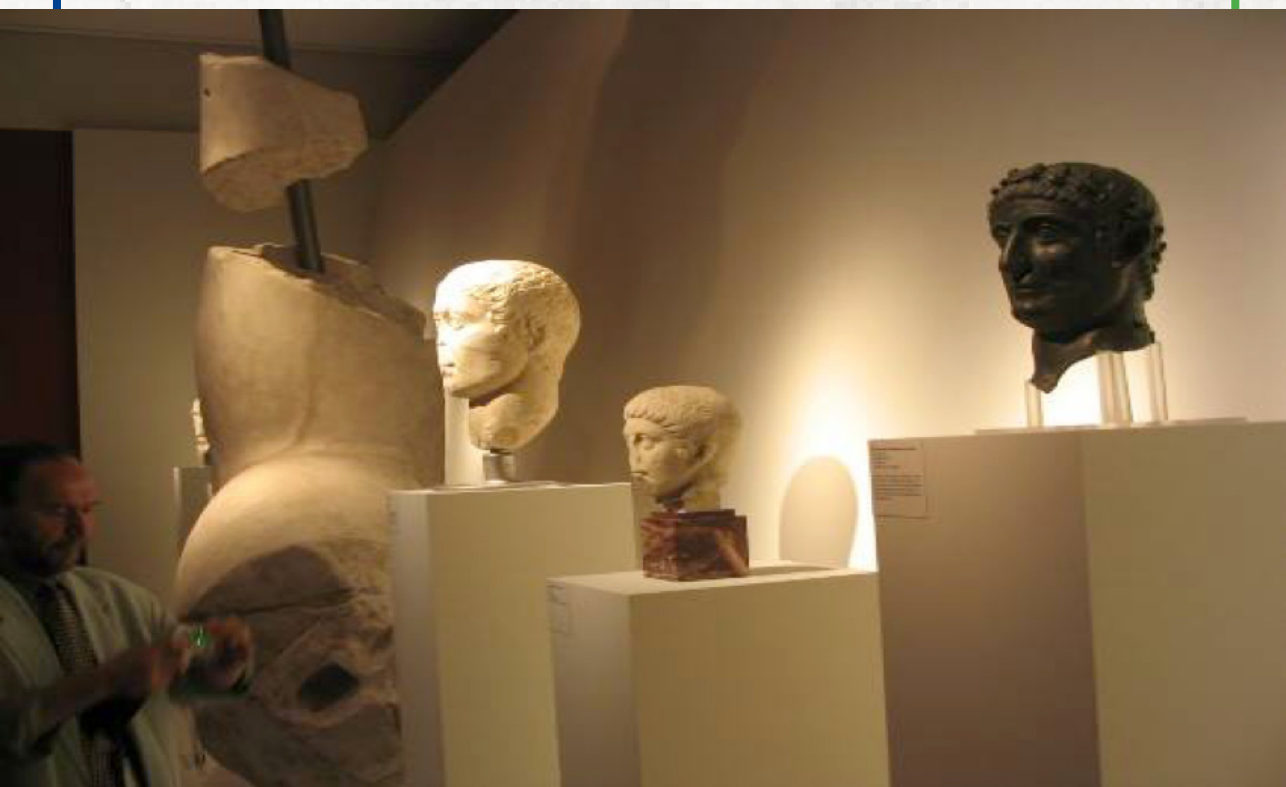
Sl. 16. Izložba Konstantin Veliki, Trijer, 2007. godina.

kada su centralni Balkan i naročito teritorija današnje Srbije dospeli u „samu žižu istorijskih i kulturnih zbivanja o čemu blistavo svedoči arheološko nasleđe našeg tla“ (Sl. 16).