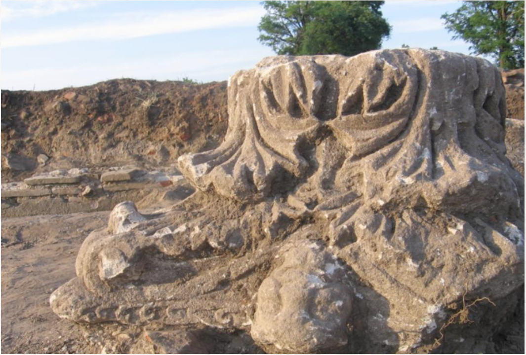
Sl. 1. Rimski kapitel in situ , utvrđenje Dijana, kod Kladova

acije prošlosti, koji utiče na formiranje vrednosti i stavova, traži stalno preispitivanje (Sl. 2).