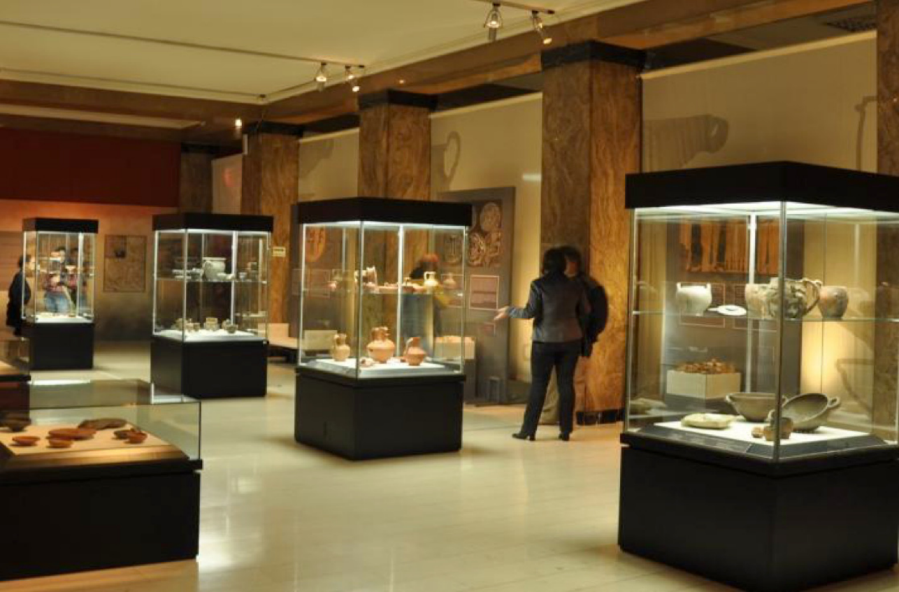
Sl. 7. Izložba Kale Krševica , Narodni muzej u Beogradu 2012.