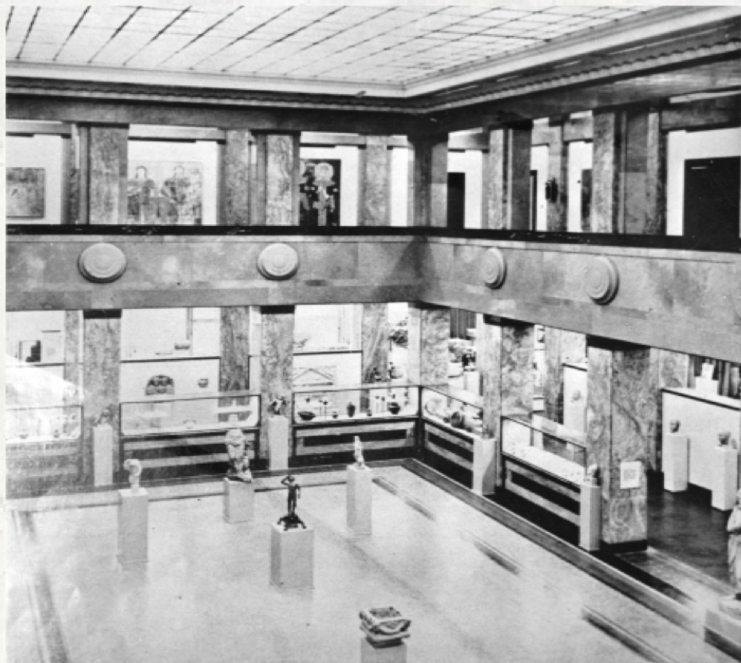
Sl. 11. Arheološka postavka Narodnog muzeja, 1950/60-te

Ovaj plan poslužio u konstrukciji pravolinijskog umetničkog – duhovnog – kontinuiteta. A on je počivao na antičkom nasleđu. Veliki prostor u centru izložbenog dela u prizemlju, akcentovan dvostrukom kolonadom stubova, nalik na atrijum, u prve dve postavke iskorišćen je i kao središte i fokus postavke (Sl. 11 i 12), namenjen najreprezentativnijim predmetima – antičkoj skulpturi. Postavljanje u cen-