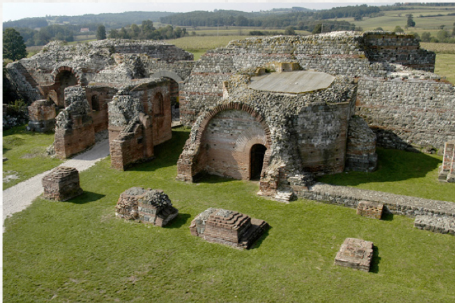
Sl. 6. Carska palata Romulijana, kod Zaječara

tori rođeni na Balkanu, kao što je Romulijana koju je sagradio Galerije (Sl. 6), Šarkamen - Maksimin Daja, palata odnosno veliki ekonomski centar u Medijani, carska palata u Sirmijumu, ili u 6. veku grad Iustiniana Prima koji je podigao Justinijan. Invazija Huna sredinom 5. veka dovela je do povlačenja rimske vojske sa severne granice, koje je trajalo više od pola veka, te urušavanja rimske administracije. U naseljima se pojavilo novo, varvarsko stanovništvo. Kratak period ranovizantijskog jačanja rimske vlasti i obnove i ojačavanja fortifikacija završio se avaro-slovenskim osvajanjem ovih teritorija početkom 7. veka.