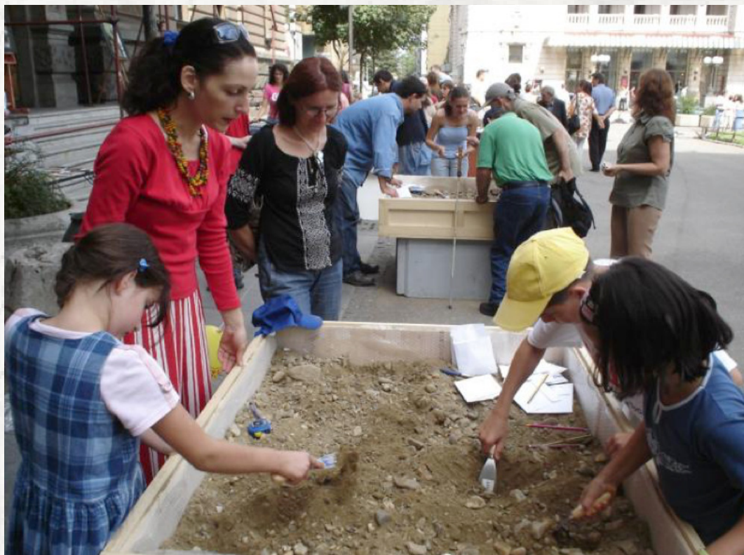
Sl. 20. Dečje radionice Narodnog muzeja u Beogradu (foto autor, 2004)

je otkrije znalac, ponudimo mnoge verzije prošlosti, koje zajedno daju široki spektar informacija i emocija.