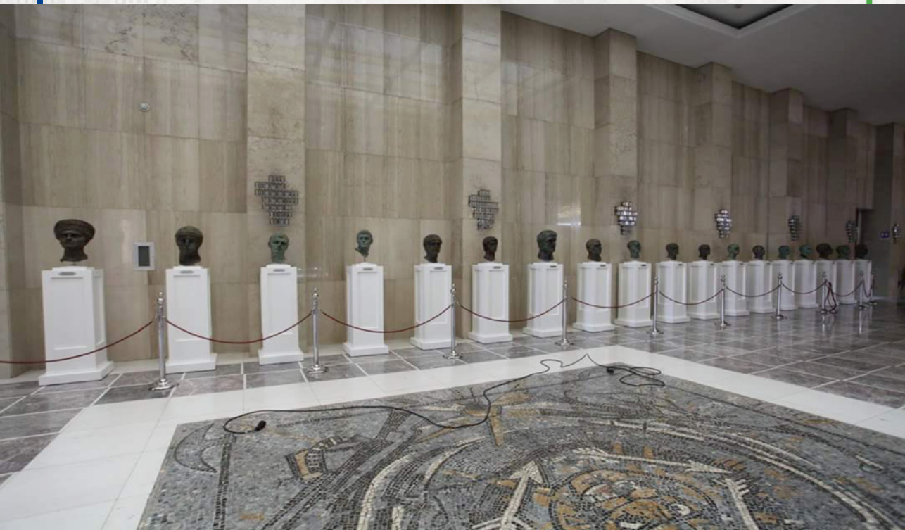
Sl. 19. Izložba Rimski imperatori rođeni na tlu Srbije , 2017. godina

Kulminacija ove konstruisane veze bio je izložbeni kompleks priređen u junu 2017. godine, povodom svečanog prijema predsednika Srbije Aleksandra Vučića, u Palati Srbije. Ovde su, pored arheološkog nasleđa, bila predstavljena raznorodna kulturna i druga dobra iz svih krajeva Srbije, od praistorije do modernog doba, do danas. Ističemo jedan od segmenata – portrete rimskih imperatora rođenih na tlu Srbije (Sl. 19), čiji je broj sada već dostigao 18. Portreti su ovovremeni, gipsani,